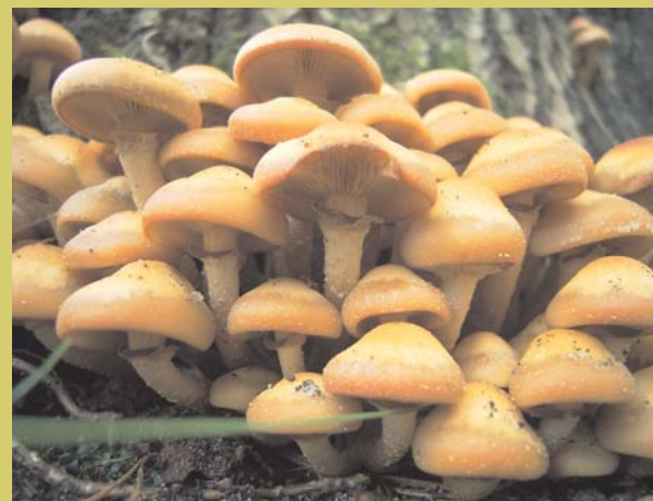
Stockschwämmchen, Kuehneromyces mutabilis , Stiel mit Ring, unterhalb des Ringes absteigende Schuppen essbar

опёнок летний, ножка с кольцом и приросшими под ней пластинками съедобный