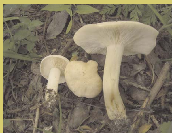
Mairitterling, Calocybe gambosa , Vorkommen im Laubwald, Gärten und Parks, nur im Frühjahr. essbar

майский гриб, встречается только весной в лиственном лесу, садах и парках съедобный