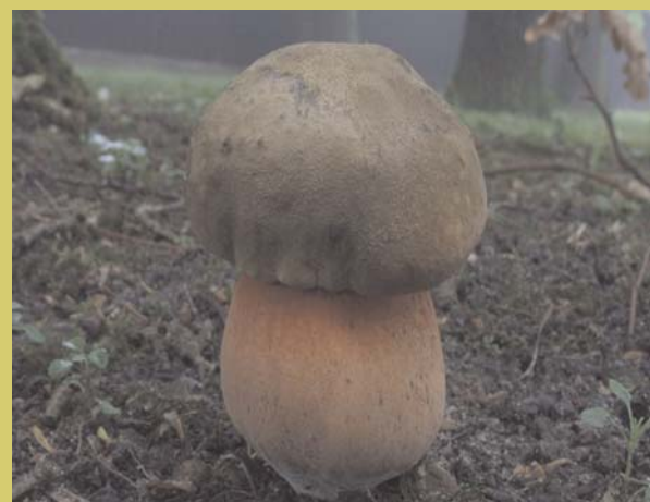
Flockenstieliger Hexenröhrling, Boletus erythropus , Vorkommen im Laub- und Nadelwald essbar

дубовик крапчатый, встречается в лиственных и хвойных лесах съедобный