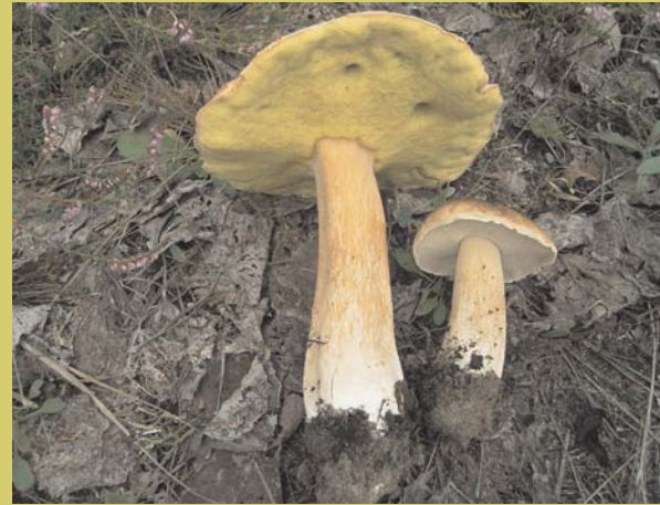
Steinpilz, Boletus edulis , Vorkommen im Laub- und Nadelwald essbar

Essen sie niemals Pilze, die sie nicht ganz sicher kennen. Никогда не ешьте грибы, которые вы не знаете точно.